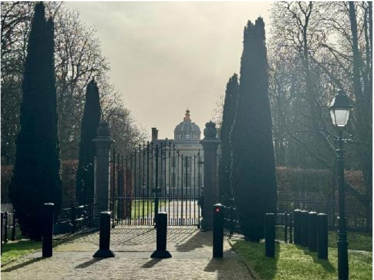
Paleis Huis ten Bosch

Omstreeks 1230 bouwen de graven van Holland hun jachtslot op een strategische plek tussen Delft en Leiden én op een plek waar ze goed kunnen jagen: in het Haagse Wil Bos. Dit jachtslot is uitgegroeid tot wat nu het Binnenhof is. De graven regeren het bosrijke gebied vanuit dit slot. Rond het slot groeit de stad Den Haag. Het Haagse Bos blijft bestaan en geniet grafelijke bescherming omdat de graven er door de eeuwen heen graag jagen. De invloed van stadhouder Frederik Hendrik, de jongste zoon Willem van Oranje, groeit en op initiatief van zijn vrouw, de Duitse gravin Amalia van Solms, laat hij in 1645 hun buitenverblijf bouwen in het Haagse Bos. Tussen 1733 en 1743 worden aan dit 'Huis in het Bos' twee vleugels bijgebouwd en Prins Willem IV noemt het vanaf dan Paleis Huis ten Bosch.