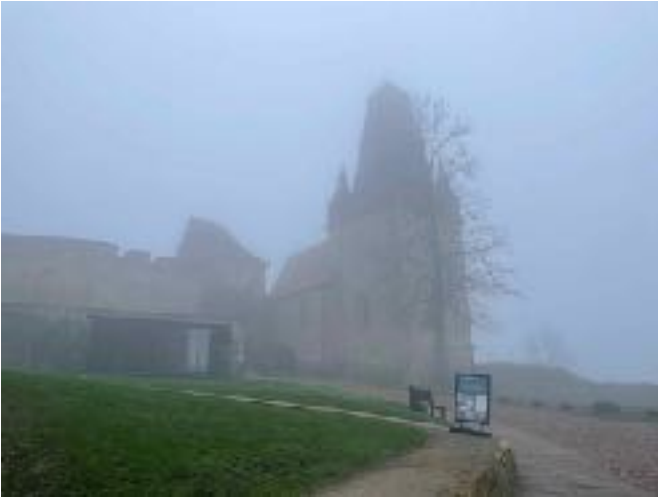
Mooie kiekjes van mooie straatjes, dat is ook Bad Bentheim.